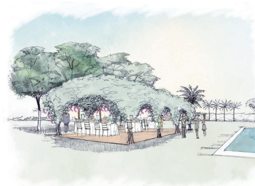
The Wisteria Retreat

Cuéntenos su idea y permítanos asesorarle en la confección de veladas y encuentros imaginativos y elegantes con los que agasajar a sus invitados, presentar un producto, servicio o sencillamente vestir un día especial.