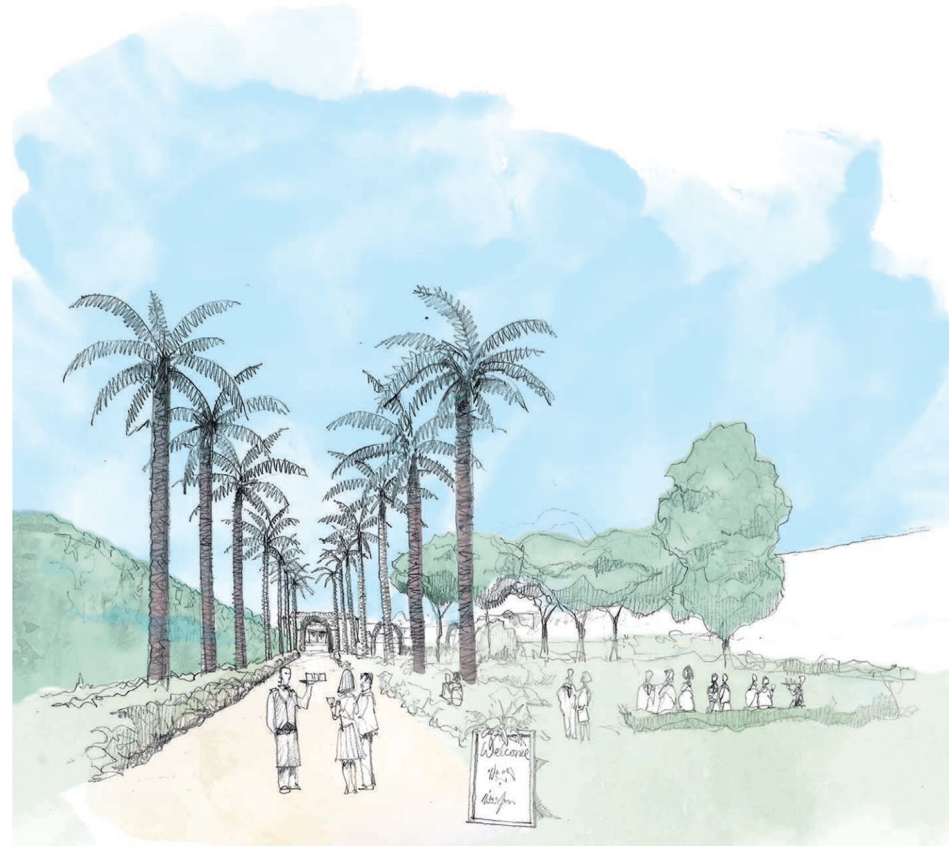
The Lavender Walk

Hidden just a few kilometres from central Seville, this unique property is easily accessible yet extremely private. Its exquisite, perfumed gardens contain an array of native and exotic plants, greeting the senses with unexpected splashes of colour and enticing scents.