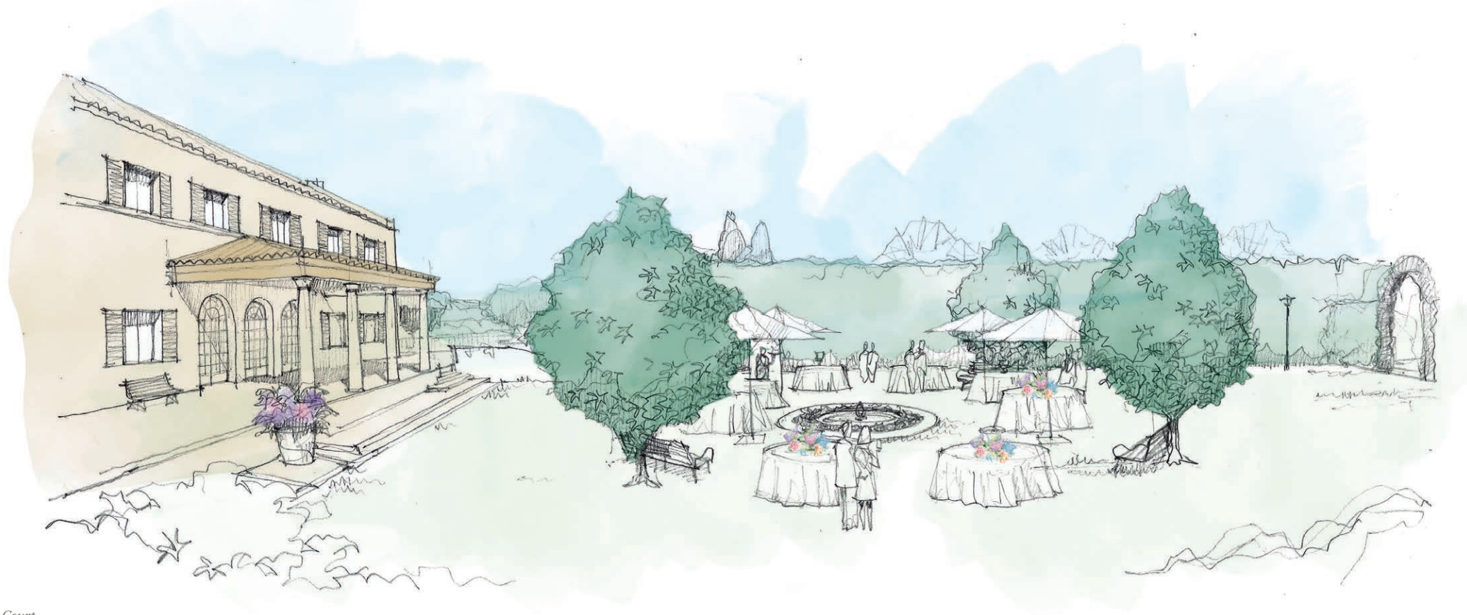
The Magnolia Court

The extensive grounds of Bella Sombra lend themselves to be the perfect venue for your special event, offering 13,000m 2 of versatile space. You will find lawns, gardens, fountains, porticos and terraces ready to be transformed into a breathtaking setting to suit your unique event. We have open spaces and intimate nooks, a sweeping avenue of lavender and of