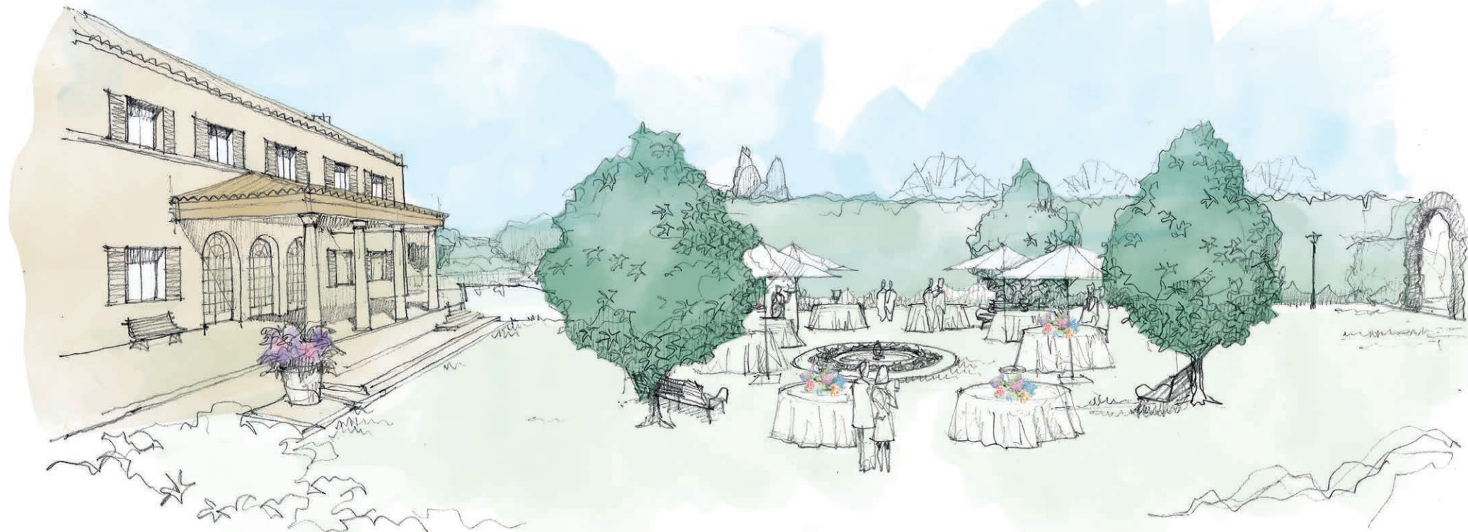
The Magnolia Court

Se nos presenta como una sorpresa inesperada que seduce a los visitantes con sus jardines maravillosamente perfumados y un paisajismo elegante y sofisticado, salpicado de árboles, plantas autóctonas y especies exóticas. Un jardín secreto rodeado de estímulos con la luminosidad