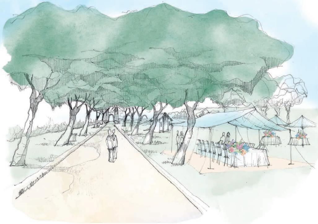
The Scented Garden

Hidden just a few kilometres from central Seville, this unique property is easily accessible yet extremely private. Its exquisite, perfumed gardens contain an array of native and exotic plants, greeting the senses with unexpected splashes of colour and enticing scents.